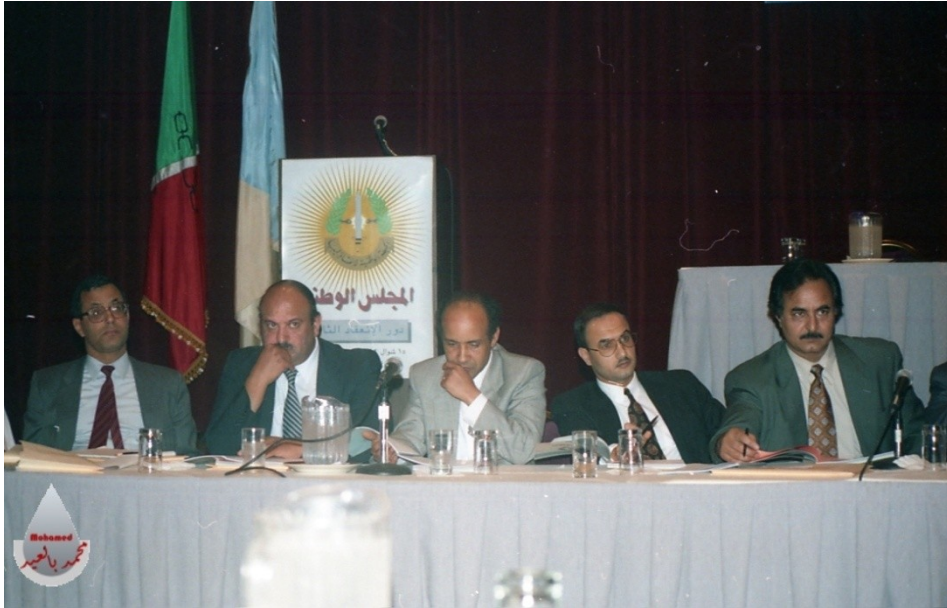
المجلس الوطني الثالث للجهة في دالاس بأمریکا سنة 1992