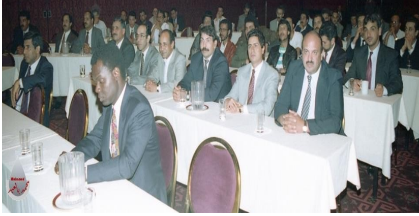
الثالث للجهة في دالاس بأمریکا سنة 1992